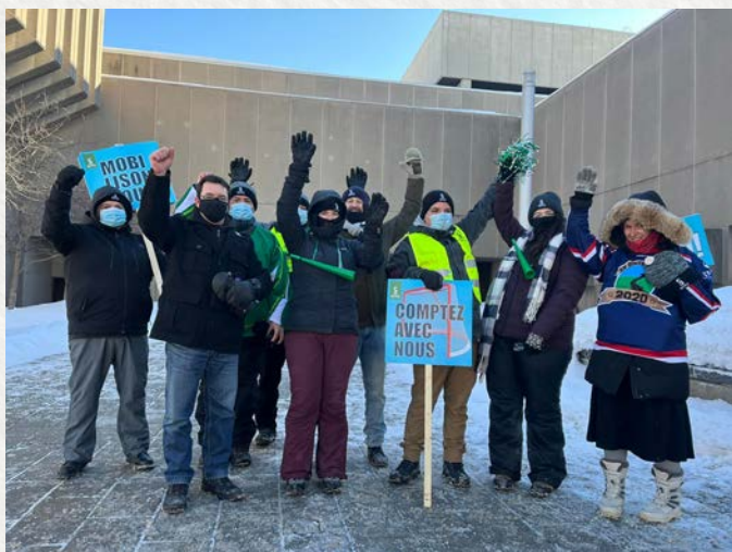
Mobilisation au Conseil du trésor, janvier 2022