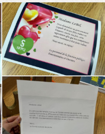
En cette Saint-Valentin, le Comité national des jeunes (CNJ) a eu la douce attention de remettre une carte à leur «valentine» de l'année : la présidente du Conseil du trésor