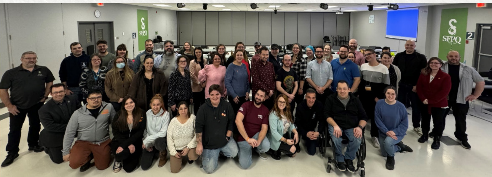
Rencontre du Réseau des jeunes - 15 et 16 février 2024

Le Comité national des jeunes a effectué plusieurs rencontres avec les RRJ et leur substitut. Comme les rencontres durent une demi-journée, nous les avons majoritairement tenues en mode virtuel afin d'éviter des frais de déplacement. Lors de ces rencontres, nous discutons des événements à venir et de ceux qui se sont déroulés.